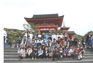
【清水寺仁王門(目隠し門)にて】

二日目は、旅館を7:35に出発し、USJに向かいました。USJは一昨年の4月に『MINION PARK』エリアが誕生するなど、たくさんの観光客でいっぱいでした。班別行動では、昼