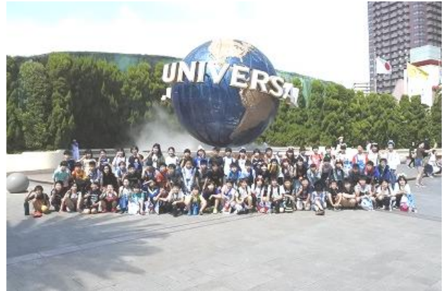
【ユニバーサルスタジオジャパンにて全員集合】