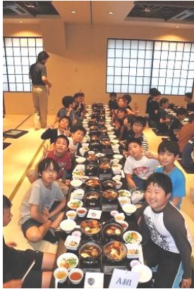
【旅館での夕食風景】