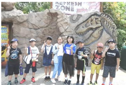
【ジュラシックパーク前にて】